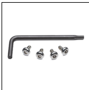
310176 Anti-Vandalismus-Set, Edelstahl