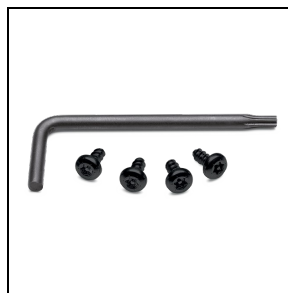
310177 Anti-Vandalismus-Set, brüniert